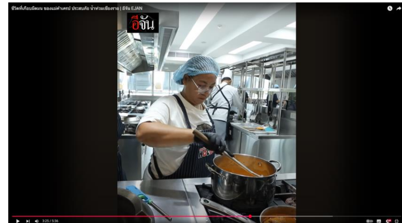
ชีวิตที่เกือบมืดมน ของแม่ค้าเครป ประสบภัย นำท่วมเชียงราย | อีจัน EJAN