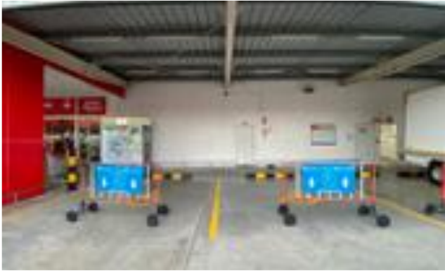
การจัดพื้นที่จอดรถ และห้องน้ำสำหรับผู้พิการและผู้สูงอายุ

100% ทุกสาขามีพื้นที่จอดรถทางลาด และห้องน้ำสำหรับผู้พิการและผู้สูงอายุ