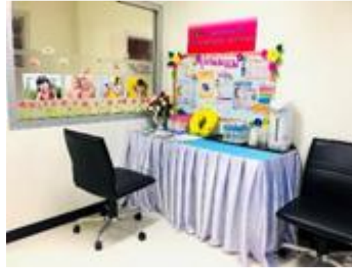
ห้องเตรียมน้ำนม

100% ทุกสาขามีพื้นที่จอดรถทางลาด และห้องน้ำสำหรับผู้พิการและผู้สูงอายุ