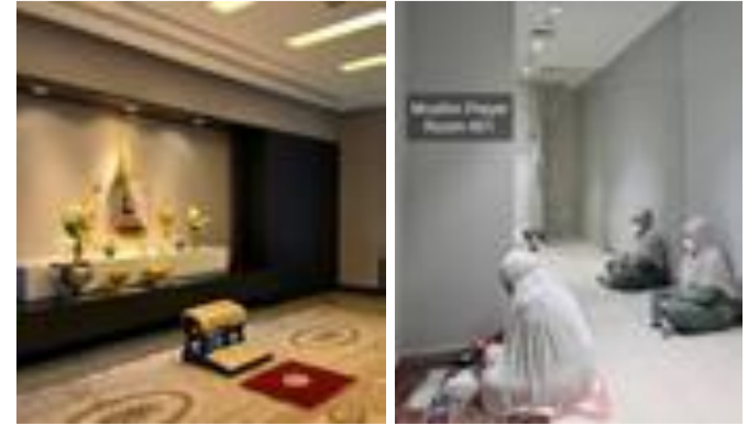
ห้องประกอบพิธีตามหลักศาสนา

100% ทุกสาขามีพื้นที่ เครื่องใช้ไฟฟ้า และอุปกรณ์ เพื่ออำนวยความสะดวกให้พนักงานหญิงจัดเตรียมนมบุตร