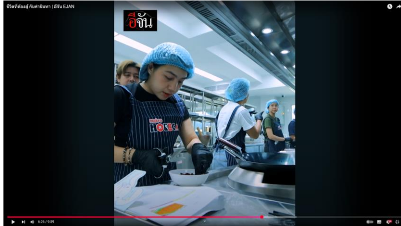
คลิกเพื่อดู ชีวิตที่ต้องสู้ กับคำนิทาน | อัจฉิน EJAN

บริษัทฯ โครงการต่างๆ ที่สนับสนุน และพัฒนาผู้หญิง และกลุ่มเปราะบางในชุมชนให้มีทักษะอาชีพ และสามารถสร้างรายได้เพื่อเลี้ยงดูตนเอง และครอบครัว อาทิ โครงการคู่คิดคนมีฝัน