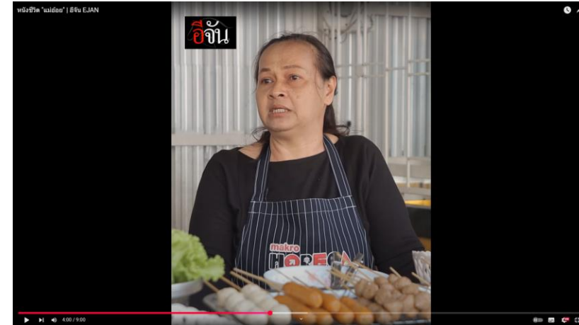
คลิกเพื่อดู หญิงชีวิต "แม่อ้อย" | อัจฉิน EJAN

**For English subtitle, you can switch on Closed captioning (CC) auto-translate to English on YouTube